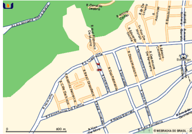
Mapa colorido – vários tons: Entropia = 2.6300